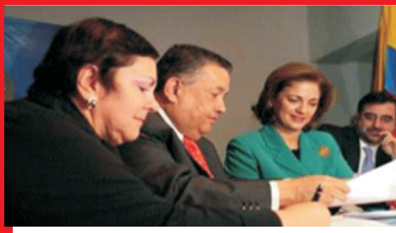
Acto de firma del Pacto "Notaría Digital para la Comunidad" Bogotá, D.C. 3 de diciembre de 2009