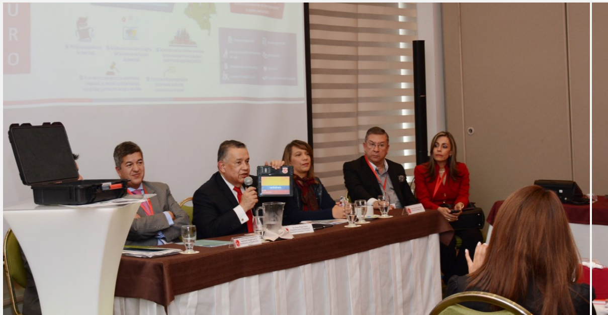
El Proyecto de Biometría Móvil fue presentado en el marco del Taller de Nuevas Tecnologías, realizado en octubre de 2016.